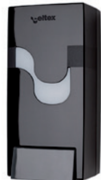
ABS schwarz Art. 116 276*