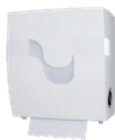
ABS weiß Art. 116 344*