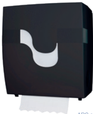
ABS schwarz Art. 116 337*