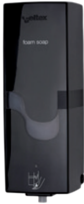
ABS schwarz Art. 115 903*